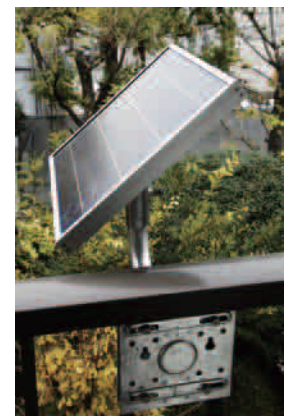
ソーラーパネル取り付け架台