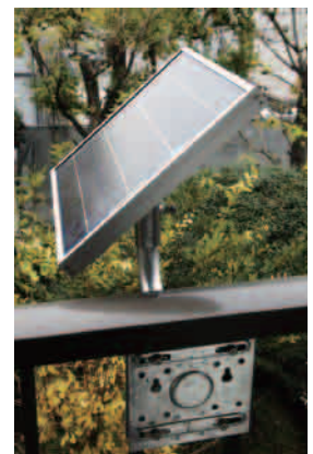
ソーラーパネル取り付け架台

出力： 24時間出力 夕暮れ～夜明け出力 バッテリー： シールド12V 20Ah 寿命2～3年