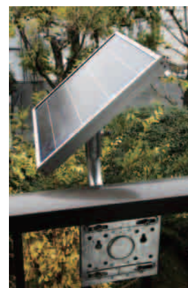
ソーラーパネル取り付け架台