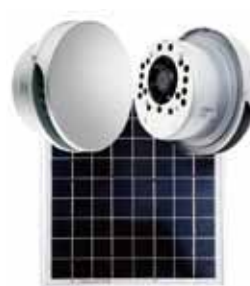
平型カバー付シングルユニット