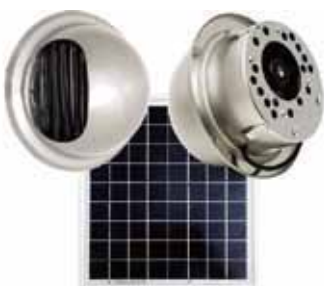
ドーム型シングルユニット