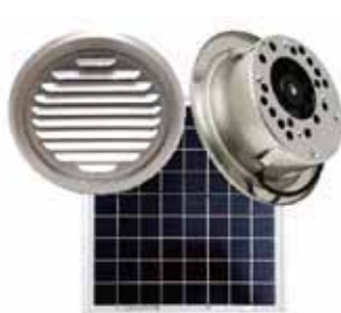
平型シングルユニット