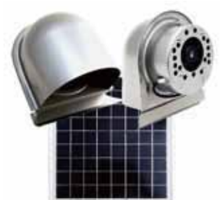
深型シングルユニット