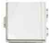
ハイブリット安定化電源